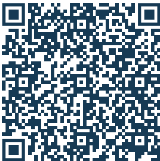
Бобышки для резервуарного оборудования